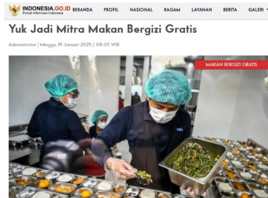
Dapur Mitra MBG

Yayasan Maslakul Huda, Yayasan Muara Hikmah, Yayasan Al Hikmah, dan Yayasan Al Fitrah 1.